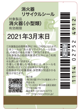
リサイクルシール