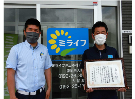
岩手県危険物安全協会連合会長 「優良事業所表彰」 ミライフ東日本株式会社 様