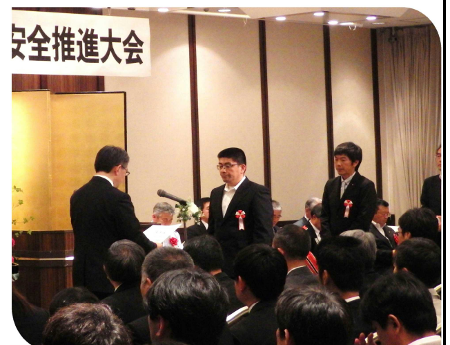
岩手県知事感謝状「優良危険物関係事業所」 綾里漁業協同組合 様